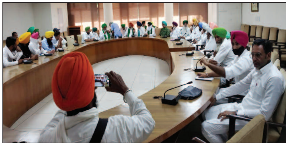
ਵਟਾਂਦਰਾ ਕੀਤਾ ਗਿਆ। ਭਾਰਤੀ ਕਿਸਾਨ ਯੂਨੀਅਨ (ਲੱਖੋਵਾਲ) ਦੇ ਬਰਨਾਲਾ ਜ਼ਿਲ੍ਹੇ ਦੀ ਸਮੁੱਚੀ ਲੀਡਰਸ਼ਿਪ ਨੇ ਅਸਤੀਫ਼ੇ ਦਿੱਤੇ ਟੱਲੇਵਾਲ (ਬਰਨਾਲਾ) - ਭਾਰਤੀ ਕਿਸਾਨ ਯੂਨੀਅਨ

ਅਮਰਿੰਦਰ ਸਿੰਘ ਨਾਲ 29 ਸਤੰਬਰ ਨੂੰ ਹੋਈ ਗੱਲਬਾਤ ਦੌਰਾਨ ਕੀਤੇ ਵਾਅਦਿਆਂ ਸਬੰਧੀ ਨਵੀਂ ਪੁਨੀਸ਼ਨ ਪ੍ਰਤੀ ਖੁੱਲ੍ਹ ਕੇ ਵਿਚਾਰ