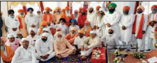
ਪੋਸਟ ਮੈਟ੍ਰਿਕ ਸਕਾਲਰਸ਼ਿਪ ਦੇ ਮੁੱਦੇ ਨੂੰ ਲੈ ਕੇ 10 ਅਕਤੂਬਰ ਨੂੰ ਸਮੂਹ ਸੰਤ, ਸਮਾਜ ਇਕੱਠਾ ਹੋ ਕੇ ਕਰੋਗਾ ਪ੍ਰਦਰਸ਼ਨ। (ਰਿਪੋਰਟ ਦੇਖੋ ਸਫਾ 11 'ਤੇ)